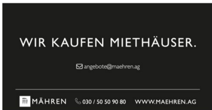
1/8 Seite Eckfeld quer 193x100 mm