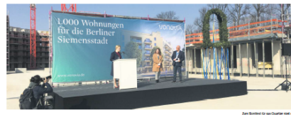
Berlin. Das Wetter war wie bestellt, als am vergangenen Freitag nicht nur der Richtstein für dem Bauwerkhaus von Vivanco in der Siemensstadt hochgezogen wurde...