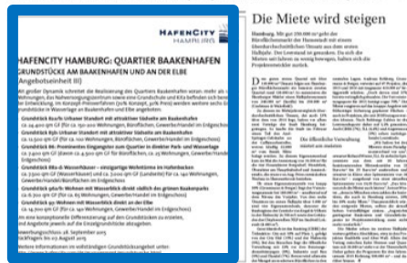
1/4 Seite Eckfeld 193x200 mm