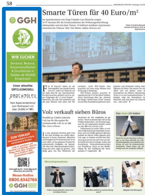
1/4 Seite hoch 54x307 mm Messezeitung