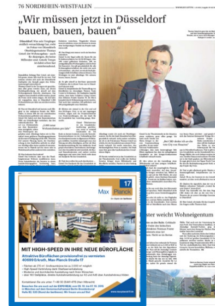
1/4 Seite Eckfeld 193x200 mm