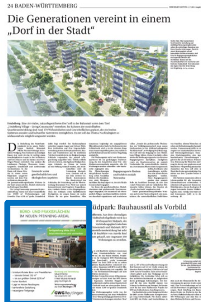
1/8 Seite Eckfeld 127x150 mm