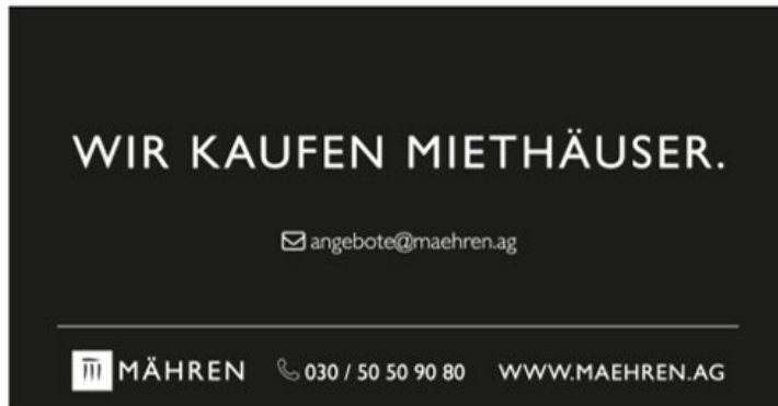
1/8 Seite Eckfeld quer 193x100 mm