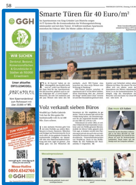
1/4 Seite hoch 54x307 mm Messezeitung